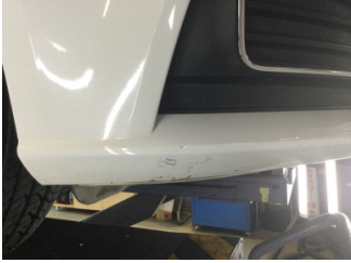
Tampon, n, n tampon > izik