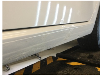
Marřbiyel, sol, Marřbiyel, sol > Ezik