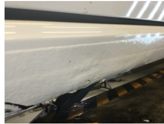
Marřbiyel, sol, Marřbiyel, sol > Ezik