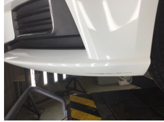
Tampon, n, n tampon > izik