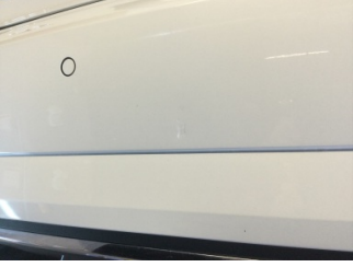
Tampon, arka, Arka tampon > Rötüş