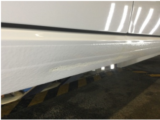
Marřbiyel, saė, Marřbiyel, saė > Ezik