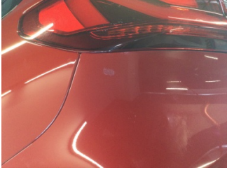
Tampon, arka, Arka tampon > Rötüş