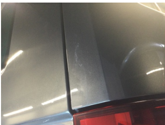
Bagaj kapađı/kapısı, Bagaj kapısı > Yakıcı Madde ile Zarar Görmüş