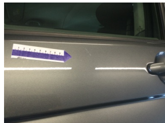
Kapı, sol ön, Kapı, sol ön > Rötüş