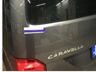
Bagaj kapađı/kapısı, Bagaj kapısı > Ezik