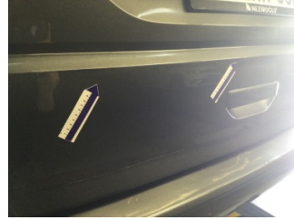
Bagaj kapađı/kapısı, Bagaj kapısı > Ezik