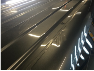
Tavan, Tavan > Ezik