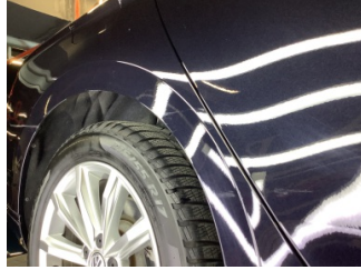
Çamurluk, sağ arka, Çamurluk, sağ arka > Çizik