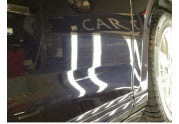
Çamurluk, sağ, Çamurluk, sağ > Çizik