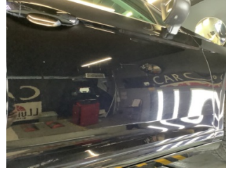
Kapı, sağ ön, Kapı, sağ ön > Çizik