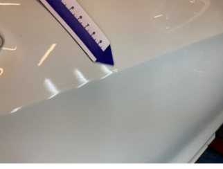
Kapı, sağ ön, Kapı, sağ ön > Ezik