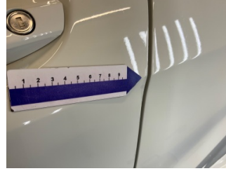
Kapı, sol ön, Kapı kenarı > Rötüş